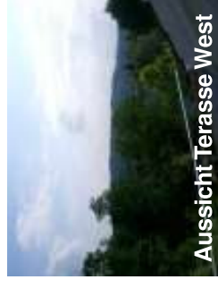
Aussicht Terrasse West