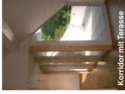
Korridor mit Terrasse